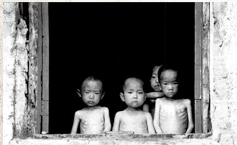
〈고난의 행군 당시 북한 어린이들 (자료사진)〉

브로커가 데리고 간 곳은 어느 아파트였다. 밤새 정신없이 강을 건너고 길을 걸은 터라 정말 시장했던 우리에게 밥을 주는데 하얀 쌀밥에다가 감자국에 김치를 줬다. 이게 웬 쌀밥인가 하고 우리 세명의 눈이 휘둥그레졌다. 정말 정신없이 먹었다. 식사를 마친 우리는 몸을 씻었다. 집에서 입고 온 북한 옷도 벗고 브로커가 준 옷으로 갈아입었다. 한 숨 돌리고 나서 한 방에 앉은 우리 세 여자는 통성명을 하고 이야기를 나누기 시작했다. 25살 먹은 친구는 결혼해서 이제 갓 1살된 아이가 있었지만, 먹을 것이 없어서 언니네 집에 아이를 맡겨 놓고 중국에 시집가서 아주 살려고 나왔다고 했다. 24살 먹은 아이는 아직 결혼하지 않은 처녀이고 중국에서 일해서 돈 벌러고 왔다고 했다. 나도 중국 식당에서 일하러 왔다고 했더니 24살 아이가 나와 같구나 하고 좋아했다. 이렇게 이야기를 하다보니 하루라도 빨리 일을 해야겠는데 어디서 일을 하게 될지 궁금하기도 하고 하루라도 빨리 식당을 소개받고 싶었다. 내친김에 옆방에 자고 있는 브로커를 깨워서 우리 식당 가서 일해야 되는데 구경이라도 갈 수 없는가 하고 물었다. 브로커는 껌짝 놀