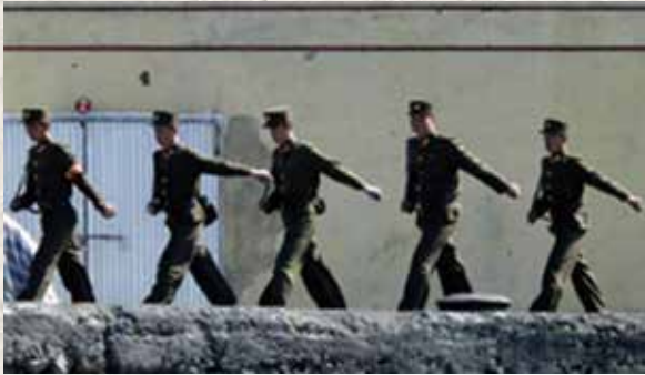
〈근무교대를 하는 북한 국경경비대원〉