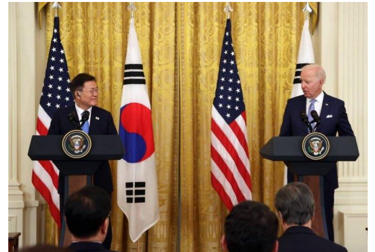
〈5월 21일 한미 정상이 공동 기자회견을 갖고 있다〉