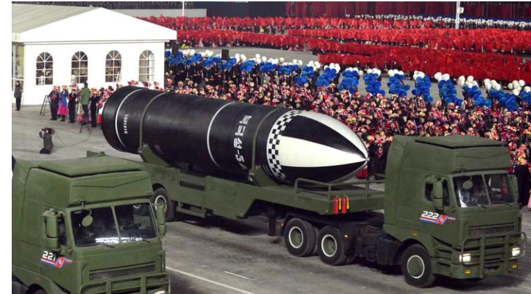
〈제 8차 당대회 후 열병식에서 공개된 SLBM〉

남한과 미국 뿐 아니라 국제사회가 지혜롭게 공조하여 북한의 핵문제를 풀어내고 이것이 한반도 평화로 이어지기를 기도합니다.