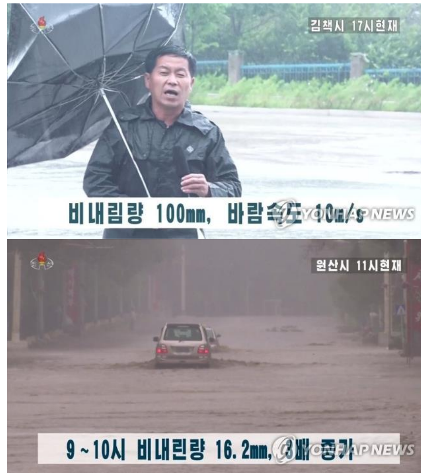
〈작년 9월 조선중앙통신의 홍수보도 모습〉

올해에도 북한의 언론들은 장마대비와 관련된 보도를 내보내고 있습니다. 올 장마철 북한에 자연재해가 발생하지 않도록 북한 당국과 주민들이 이에 잘 대비하도록 기도합니다.